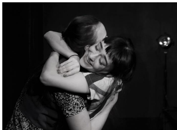
Poříčská madona