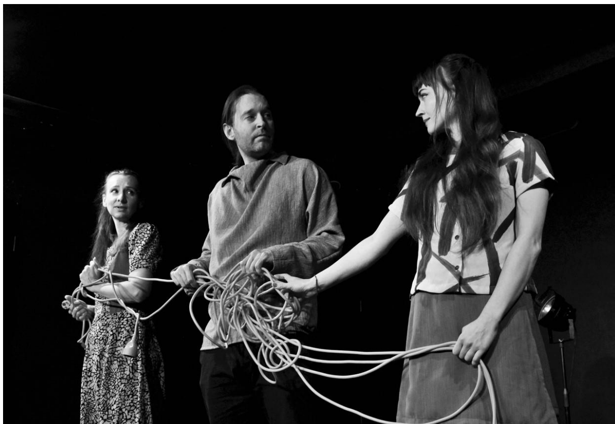
Poříčská madona

divadlo inspirované nejsoučasnější českou literaturou