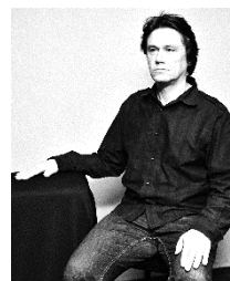
Martin V, Oidipus 11 minut

Martine, co ty bys jako dělal, kdyby ti nějaká věštka předpověděla smrt, za kterou by měl být odpovědný tvůj syn?