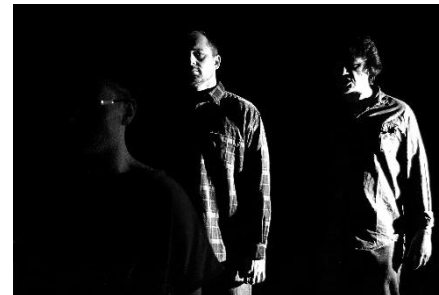
Přibližně dvaatřicet zubů