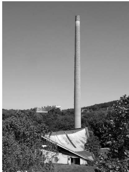
Mazutka je při pohledu ze střechy divadla kompletně obklopena romantickou jarní zelení

Individuálně architektonicky řešených výtopen neexistuje v Česku mnoho a všechny jsou z pozdějších let. Příkladem je dosud stále funkční tzv. Hvězdicová kotelna ve Slaném z let 1970-79. (hh)