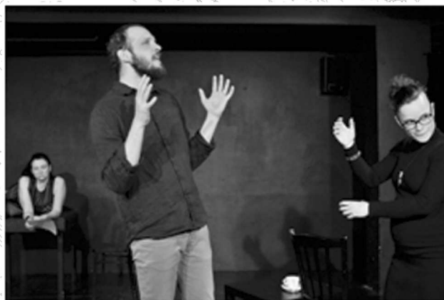
Hra Dešťová hůl je románem volně inspirovaná, vychází z jeho silového pole.

Necháváme se inspirovat motivy románu. Snažíme se žít jeho atmosféru. Doplňujeme alespoň jeden další motiv a ptáme se například: Kdo je dneska indián? Kde/co/kdo je dneska domov?